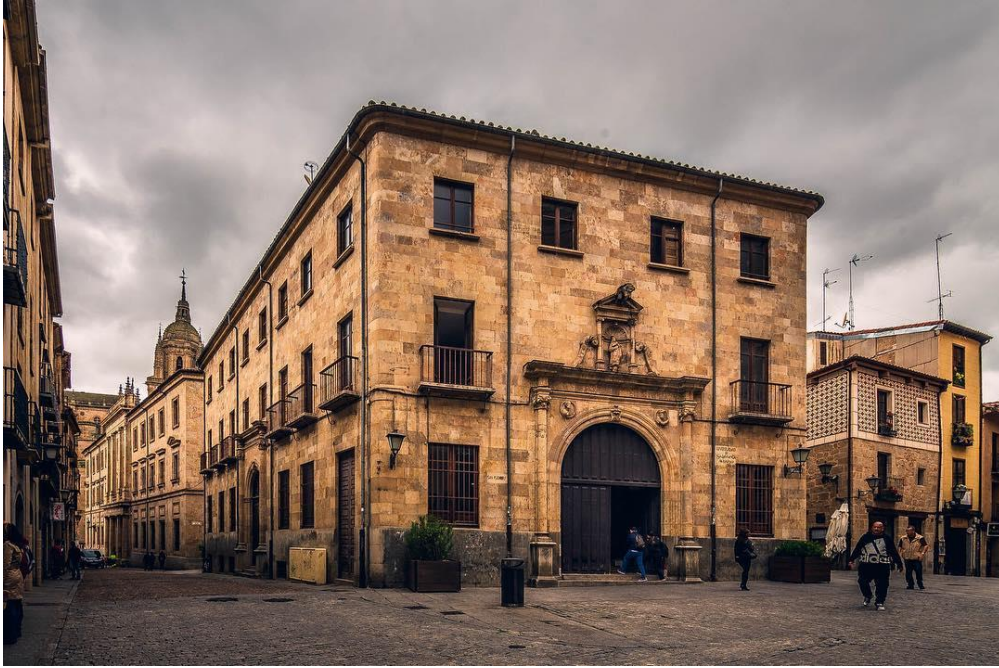
Foto: Aulario San Isidro, en la Plaza de San Isidro, donde se ubica el Centro de Estudios de la Mujer de la Universidad de Salamanca. Disponible en http://mujeres.usal.es/

Respecto a su ubicación virtual se accede mediante las siguientes direcciones: