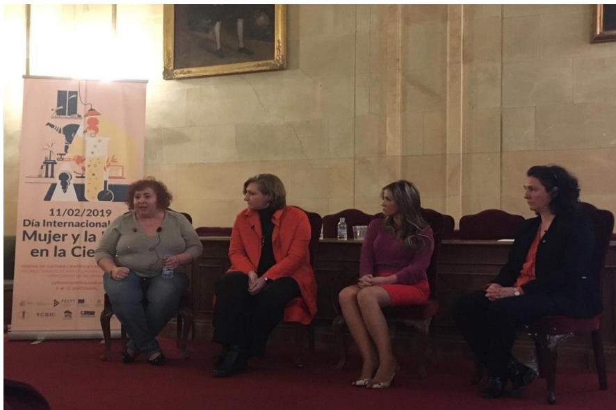
Participación en el proyecto el CSIC Las Científicas Cuentan - febrero de 2019.

Organización de las actividades celebradas en la Universidad de Salamanca para conmemorar el “Día Internacional de la Mujer y la Niña en la Ciencia”, que se han desarrollado desde el 1 al 21 de febrero de 2019, coorganizado por el Vicerrectorado de Investigación y Transferencia (Unidad de Cultura Científica e Innovación) de la USAL, FECYT, CSIC, CEMUSA y la Fundación Salamanca, Ciudad de Cultura y Saberes, habiéndose desarrollado Encuentros entre Investigadoras, Conferencias, Debates, Documentales.