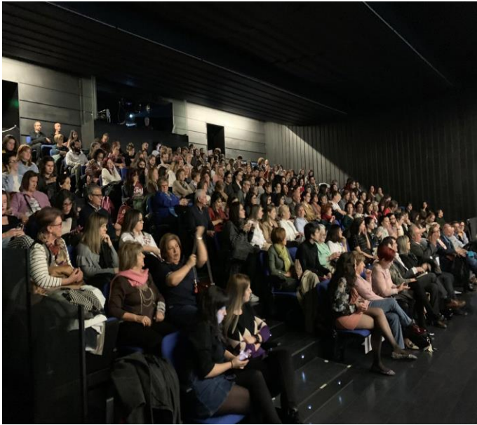
Documental “el proxeneta: paso corto, mala leche”. Teatro Juan de la Encina, 27 de febrero 2019.

Organización de las actividades celebradas en la Universidad de Salamanca para conmemorar el “Día Internacional de la Mujer y la Niña en la Ciencia”, que se han desarrollado desde el 1 al 21 de febrero de 2019, coorganizado por el Vicerrectorado de Investigación y Transferencia (Unidad de Cultura Científica e Innovación) de la USAL, FECYT, CSIC, CEMUSA y la Fundación Salamanca, Ciudad de Cultura y Saberes, habiéndose desarrollado Encuentros entre Investigadoras, Conferencias, Debates, Documentales.