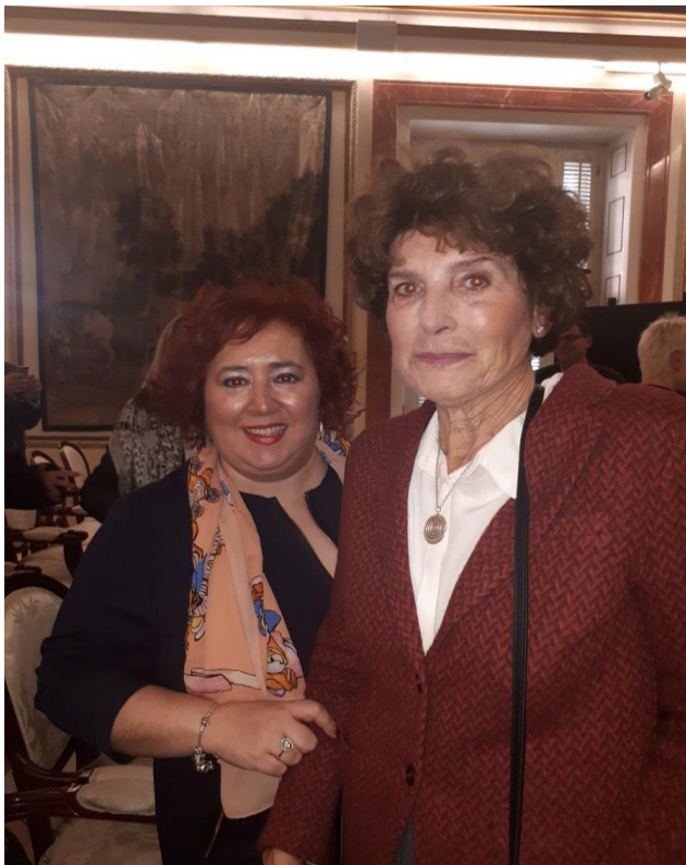
Participación en el Acto del 40 aniversario de la Constitución "Las mujeres parlamentarias en la legislatura constituyente".30 nov. 2018