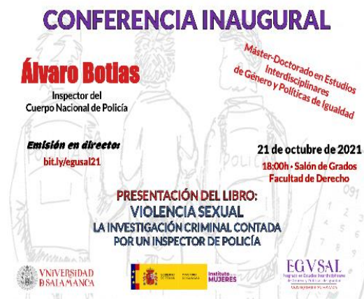
Cartel del acto inaugural.

Inauguración del del Máster en Estudios Interdisciplinares de Género y Políticas de Igualdad