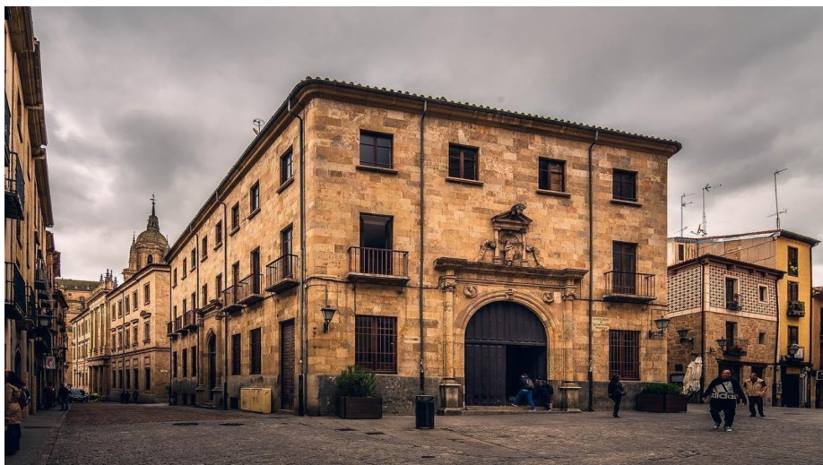
Foto: Aulario San Isidro, en la Plaza de San Isidro, donde se ubica el Centro de Estudios de la Mujer de la Universidad de Salamanca. Disponible en http://mujeres.usal.es/

Respecto a su ubicación virtual el Centro , se mantiene su página oficial que se accede mediante el enlace: https://cemusa.usal.es/ 2