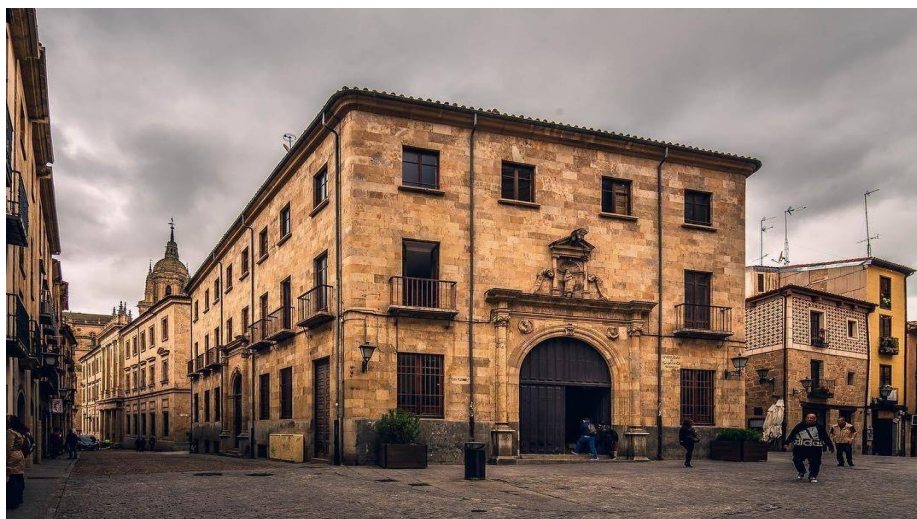
Foto: Aulario San Isidro, en la Plaza de San Isidro, donde se ubica el Centro de Estudios de la Mujer de la Universidad de Salamanca.

Respecto a su ubicación virtual se accede mediante las siguientes direcciones 2 :