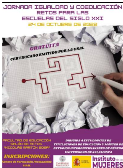
Jornada sobre Igualdad y Coeducación

Colaboración y participación en congresos organizados por estudiantes (y otros colectivos)