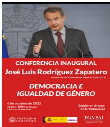
Cartel del acto inaugural.

Inauguración del del Máster en Estudios Interdisciplinarios de Género y Políticas de Igualdad